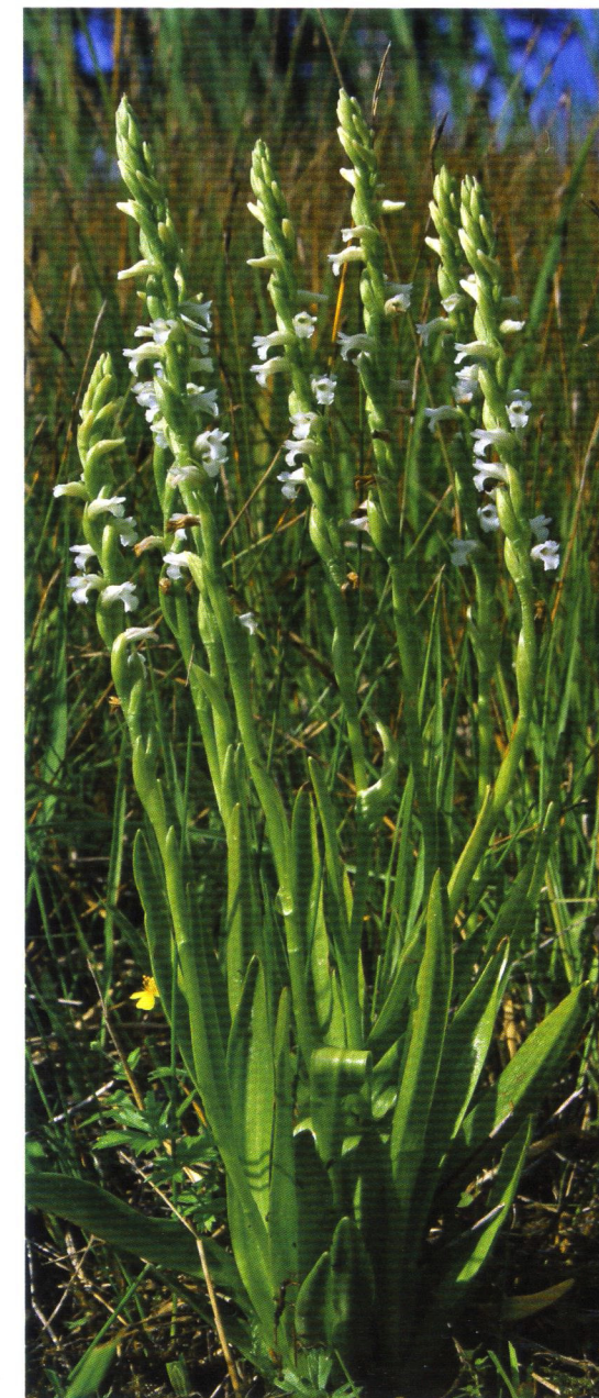
Sommer-Drehwurz Spiranthes aestivalis (Poir.) Rich.