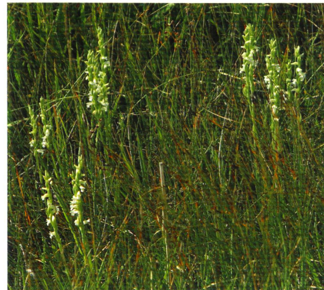
Spiranthes aestivalis im Biotop

Kennzeichnend für Spiranthes aestivalis ist der spiralig mehr oder weniger gedrehte Blütenstand mit waagrechten, weißlichen, glockig-röhrenförmigen schwach nach Hyazinthen duftenden spornlosen Blüten, die von Bienen bestäubt werden. Die schlanken Pflanzen mit oft kurvig gebogenen Stängeln werden bis zu 30 cm hoch und haben schmal-lanzettliche, aufrechtstehende Laubblätter. Als zusätzliche Reproduktions-Strategie verfügt die Sommer-Drehwurz über die vegetative Vermehrung in Form der Knollenteilung und darüber hinaus durch Bulbillen-Bildung. Sie tritt daher gerne truppweise