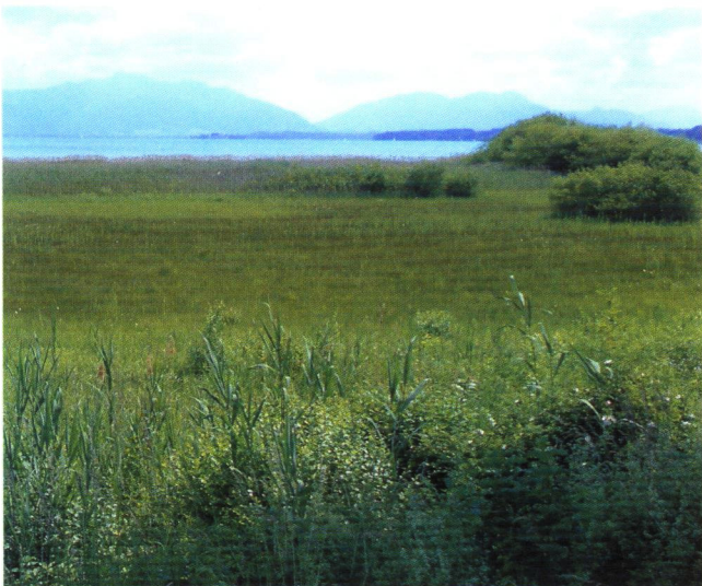
Verlandungszonen am Chiemsee - AHO-Pachtfläche seit 1985

Mit großzügiger finanzieller Unterstützung der Naturschutzbehörden und technischer Hilfe durch die Spezialgeräte der Landschafts-Pflegeverbände und Maschinenringe konnten die empfindlichen Areale weitgehend regeneriert werden, die Populationen haben z.T. Höchststände erreicht. So ist Südbayern weltweit zum Verbreitungsschwerpunkt für diese bedrohte Art geworden.