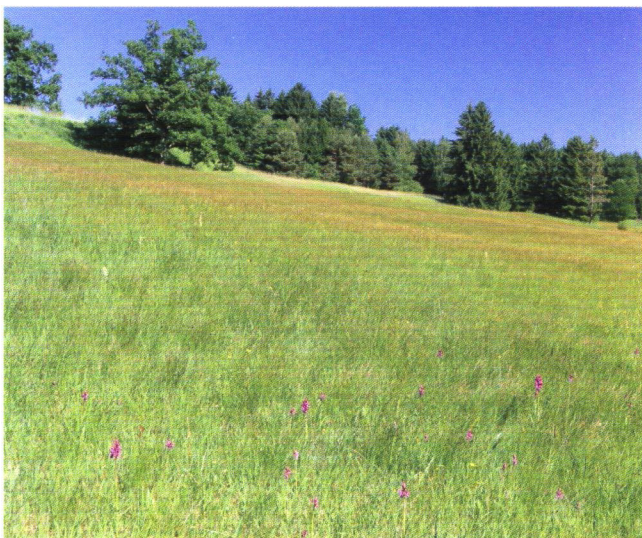
Hangquellmoor in Oberbayern - AHO-Eigentum seit 1991

Mit großzügiger finanzieller Unterstützung der Naturschutzbehörden und technischer Hilfe durch die Spezialgeräte der Landschafts-Pflegeverbände und Maschinenringe konnten die empfindlichen Areale weitgehend regeneriert werden, die Populationen haben z.T. Höchststände erreicht. So ist Südbayern weltweit zum Verbreitungsschwerpunkt für diese bedrohte Art geworden.