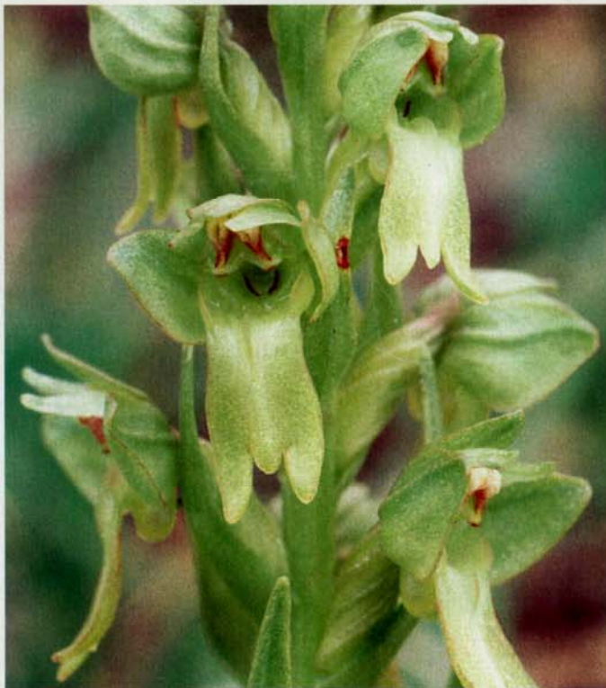
Ausschnitt aus einem Blütenstand von Coeloglossum viride

Die Grüne Hohlzunge ist ein besonders sensibler Vertreter der gefährdeten Bergwiesenflora. Mit der Orchidee des Jahres 2004 soll vornehmlich auf die Problematik der Erhaltung und Pflege der Bergwiesen aufmerksam gemacht werden.