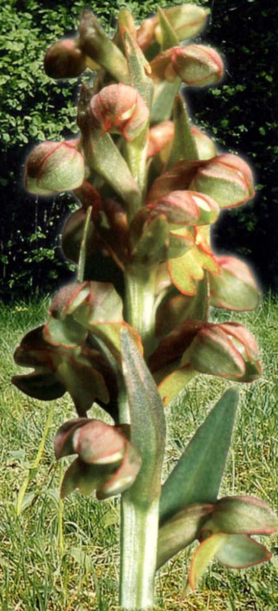
Grüne Hohlzunge Caeloglossum viride (L.) Hartm.